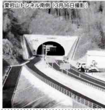
愛宕山トンネル南側(3月16日撮影)

ましたが、この程、残りの三、一㎞が完成したものです。一九九三年度に着工以来、十四年をかけての大工事で総事業費は四八〇億円、国道一八八号線は朝夕の通勤時間帯を中心に渋滞が慢性化していました。本バイパスの開通により、大幅に緩和される見込みです。国土交通省では、今度、藤生町から岩国駅前まで、二十八号が四分短縮されると予測しています。平田地区から、岩国駅前への交通も随分、楽になると思われます。愛宕山トンネルや門前川・今津川にかかる橋梁も自然と調和して、快適な運転が楽しめるそうです。今津川橋梁は維持管理費削減のため、新技術が導入されていくと聞かれます。従来の橋梁は腐食防止のため、塗装を施していますが、無塗装となつています。鋼材を腐食に強い耐候性鋼材にしているがこの新技術導入による経費削減は三十分間で四千万円といわれています。