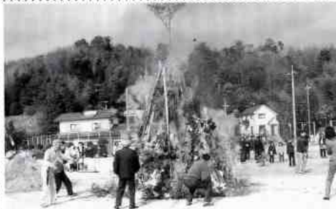
点火されると勢よく燃え上がりました