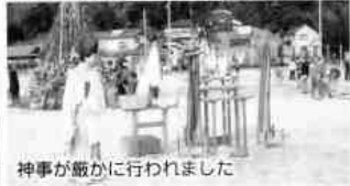
神事が厳かに行われました