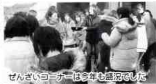
ぜんざいコーナーは今年も盛況でした