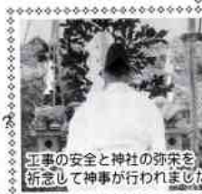
工事の安全と神社の強さを祈念して神事が行われました

三月二十三日(日)、一〇〇号を発刊する 愛宕神社の鎮地祭。起、ことができ、編集部一同 工式が牛野谷町の現地。慶賀の念と継承の大事 で行われました。愛宕、さを思っています。コ 山開発事業に伴い、飯、た結果が一〇〇号に重ね 殿になっていたところ、た結果が一〇〇号に重ね 同地域の地盤が整い、た結果が一〇〇号に重ね 本殿築造となったもの、幾人の方が携わり、欠 です。同神社は火の神、号のひらた新聞に こと一かぐつちの、卒、成長させました。これ である。保十五年(二七三〇)にやっていますので の創建と伝えられます。宜しくお願ひ申し上げます。