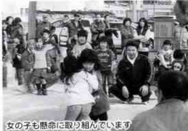
女の子も懸命に取り組んでいます

この行事の由来は、 明治時代、平田に大 火災があったのを機 に防火と火の大切さ を共有するため、小 俵を築き、土手には 屋台が建ち並び、花 火が打ち上げられ、 大人も子供も総出の 一大行事でした。 その後、平田六地 区(天地、松山、五 五)