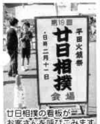
廿日相撲の看板が お客さんを呼びこみます