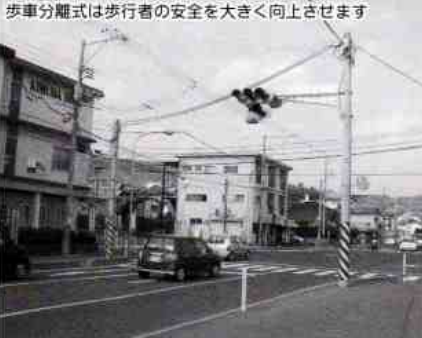
歩車分離式は歩行者の安全を大きく向上させます

三月二十二日(土)、中央フード西側交差点(梅ヶ丘入口)信号が歩車分離式に変更となりました。歩行者が青信号で横断歩道を渡っている時は、自動車などの車両は交差点に入れない方式です。つまり、歩行者用信号が青の時は、車両用の信号は全て赤ということとなります。昨年春の、いたましい交通事故に鑑み、事故防止対策の一環です。平田地区自治会連