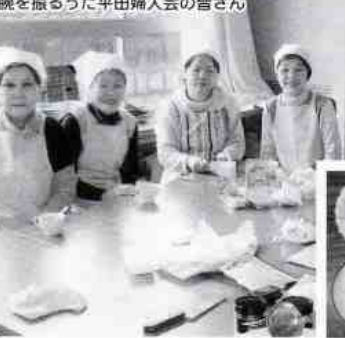
腕を振るった平田婦人会の皆さん