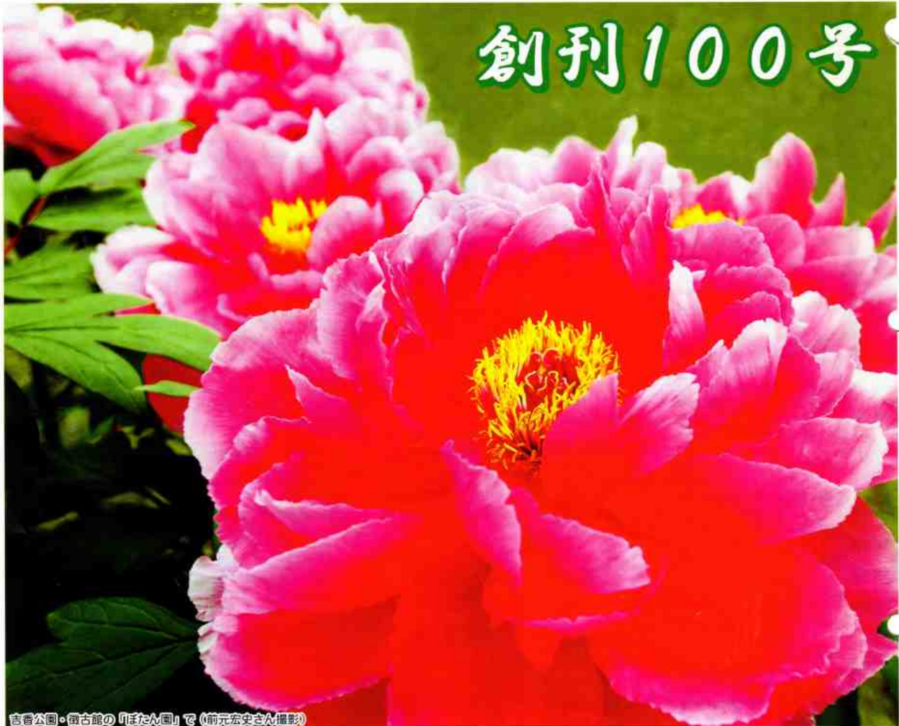
吉香公園・徴古館の「ぼたん園」で

発行所 平田地区社会福祉協議会 ひらた新聞編集部 (岩国市平田出張所内) 岩国市平田3丁目22-18 印刷所 フジ美術印刷機 岩国市今津町2丁目2-52