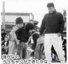
後がない うっちゃりができたかな