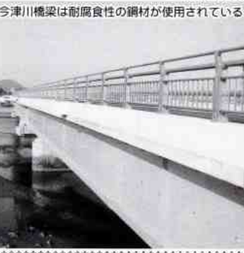
今津川橋梁は耐腐食性の鋼材が使用されている